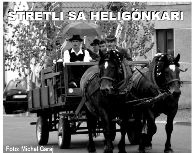
STRETLI SA HELIGÓNKARI