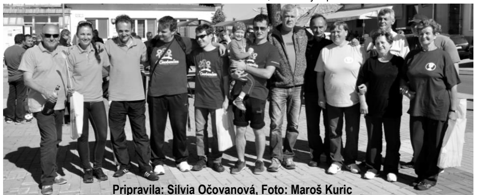
Prípravila: Silvia Očovánová

Návštevníci podujatia rozhodovali aj o udelení ceny diváka, ktorú získalo družstvo Poslancov obecného zastupiteľstva s počtom 486 hlasov.