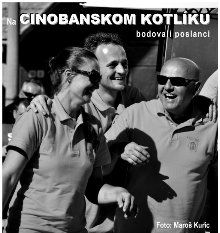
Na CINOBANSKOM KOTLIKU bodovali poslanci