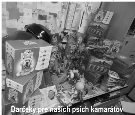
Darčeky pre našich psích kamarátov

Naša škola sa zapojila do projektu Nadácie Orange „Pomôžme útulkáčom.“ Cieľom projektu je aktívna pomoc lučeneckému útulku zvierat. V mesiacoch november a december sme navštívili útulok v Lučenci a zoznámili sme sa s jeho chľapatými obyvateľmi. Strávili sme so psíkmi krásne dva dni, poriadne nás vyvenčili po poliach pri útulku, a nakoniec sme im odovzdali vianočné darčeky v podobe rôznych maškrt a hračiek. Prajeme psikom v útulku, aby bol pre nich rok 2014 rokom, v ktorom znovu pocítila lásku a objatie v teple domova.