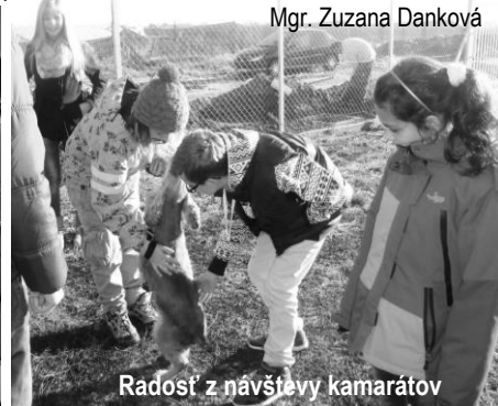
Radosť z návštevy kamarátov