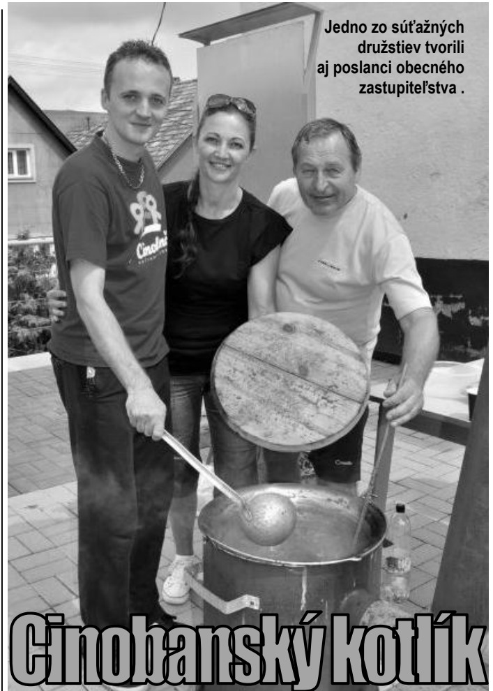
Jedno zo súťažných družstiev tvorili aj poslanci obecného zastupiteľstva .