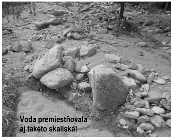
Voda premiestňovala aj takéto skaliská!

Hutnícke záhrady ma vítali ako po jesennom zbere úrody. Prázdne, len fazuľa na paliciach víťazne stála a strážila holé okolie. Všetky tvorili jeden celok bez plovov. Cesta na Hrnčiarky bola na mnohých miestach podmytá, koryto potoka narušené. Presne som mohla pozorovať, kde sa voda vyliala a okolie „vykosila“. Všade boli nánosy konárov a skál. Vzduch voňal zvláštnou vlhkosťou a potuchlinou, ako keď vstúpite do starého domu, kde už roky nikto nežil.