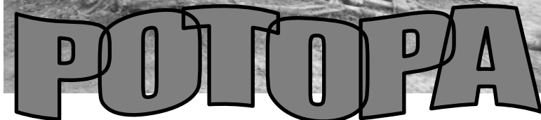
Toto priniesla voda

V posledný júlový podvečer vytvorilo zapadajúce slnko na oblohe zvláštny červenastý obraz, ktorý vyvolával rešpekt a predtuchu niečoho zlého. O pár hodín to aj prišlo.