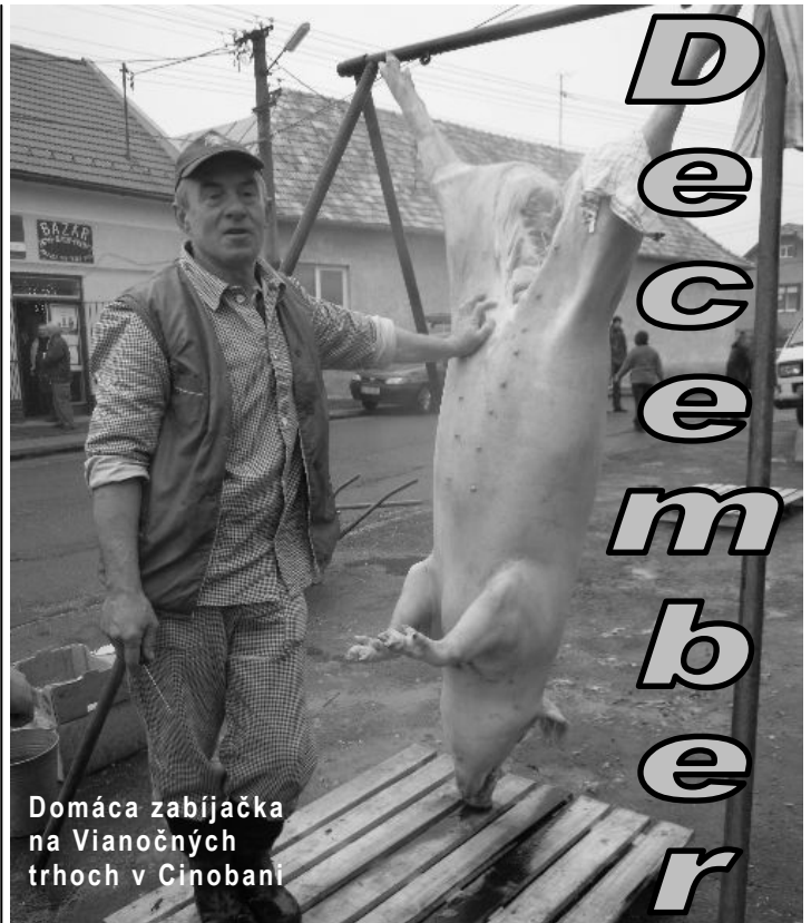
Domacia zabijačka na Vianočných trhoch v Cinobani