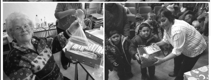
Pečenie vianočných oblátok