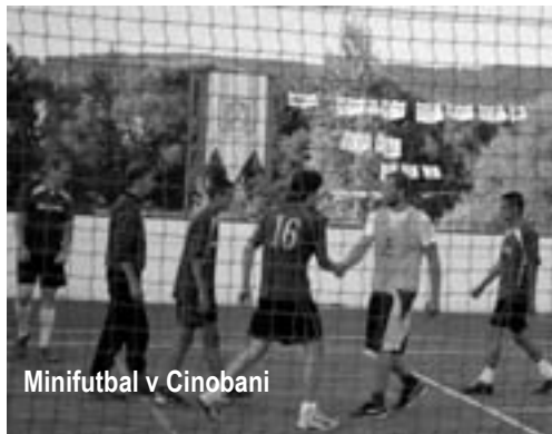
Minifutbal v Cinobani

Cez víkend 16. a 17. júla sa uskutočnili turnaje v obľúbených kolektívnych loptových hrách. V sobotu ráno odpískali v Málinci volejbalový turnaj a súbežne „za kopcom“ v obci Hradište turnaj v nohejbale. Nedľa tradície patrila futbalu. Zápsy rozohrali hodinu popoludní na viacúčelovom