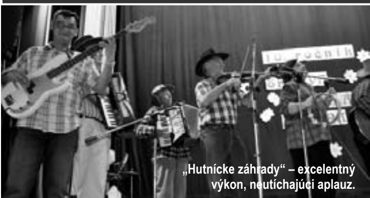
„Hutnícke záhrady“ – excelentný výkon, neutíchajúci aplauz.

Moderátorská dvojica. Stretli sa po prvýkrát a hneď si porozumeli. Ich moderátorský debut vyšiel na výbornú.