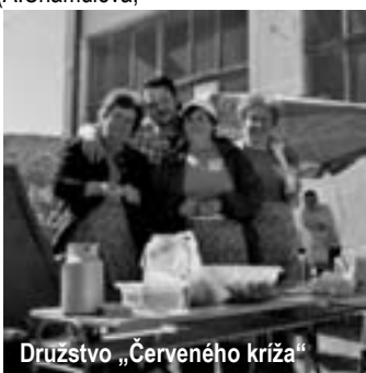
Družstvo „Červeného kríža“