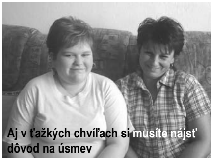
Aj v ťažkých chvíľach si musíte nájsť dôvod na úsmev