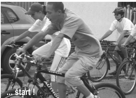
... štart !

HORNOHRADSKÝ HORSKÝ CYKLOMARATÓN NA KOLESÁCH PROTI RAKOVINE