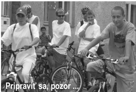
Pripraviť sa, pozor ...

HORNOHRADSKÝ HORSKÝ CYKLOMARATÓN NA KOLESÁCH PROTI RAKOVINE