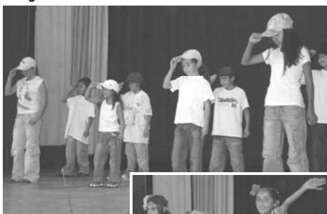
Starkým pripravili deti zo ZŠ s MŠ Cinobaňa veselý kultúrny program plný spevu, tanca a hovoreného slova.

Slávnostnú atmosféru obohatili svojím programom deti materskej školy a žiaci základnej školy pod vedením svojich učiteľov a vychovávateľov. Po bohatom kultúrnom programe nasledovalo občerstvenie, ktoré pripravila obec v spolupráci s miestnymi organizáciami.