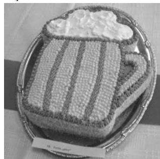
Torta „pivo“ zaujala nielen vzhľadom, ale aj chuťou.