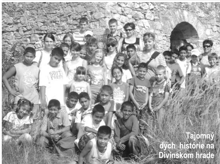
Tajomný dych histórie na Divínskom hrade