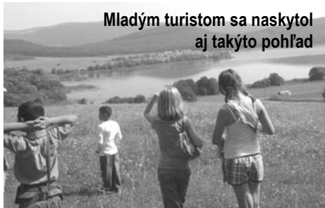
Mladým turistom sa naskytol aj takyto pohľad

Základná škola v rámci úspešného projektu Enviroprojekt 2009 v spolupráci s Miestnym kultúrnym strediskom Cinobaňa pripravili zaujímavé aktivity pre prázdninujúce deti. Posledný augustový týždeň ožili priestory školy, terasa kultúrneho domu, i okolité lesy veselým smiechom. Žiaci súťažili, športovali, čistili les, absolvovali návštevu Divínskeho hradu a naučný chodník – Tuhársky kras.