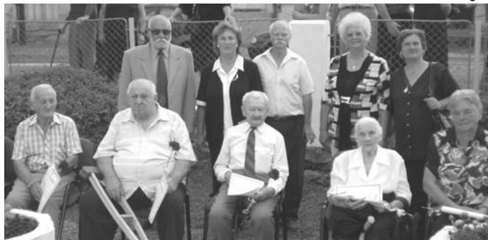
Ocenení starší spoluobčania pri príležitosti 65. výročia SNP viac na str. 3