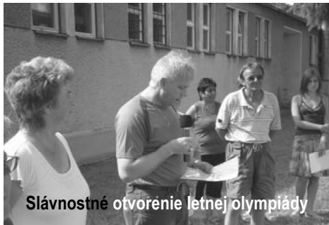
Slávnostné otvorenie letnej olympiády

Získané finančné prostriedky MŠ SR sú účelovo viazané na nákup športového vybavenia pre školu.