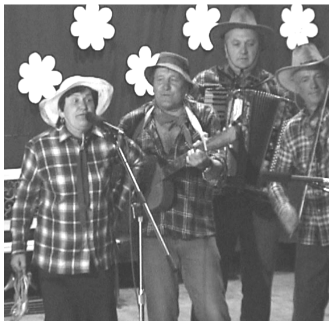
Spieva celá dolina 2008 – skvelá zábava v podaní kántri kapely Hutnícke záhrady