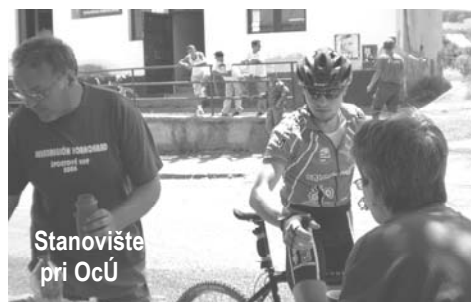
Stanovište pri OcÚ